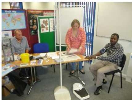
Radnici Community Health Hub-a

Za savjet/pregled se obratilo 17 posjetioca, većinom muškaraca mlađe dobi. Statistika pokazuje da od njih 17, 4 nisu bili registrirani kod GP'a, 2 su dobili uputnicu za daljnje preglede a 1 je upućen zubaru. S obzirom na uspješnost, ovakvi događaji bit će planirani i u narednom periodu.