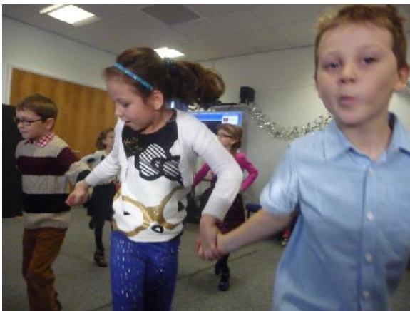
Bosanski Biseri na probi