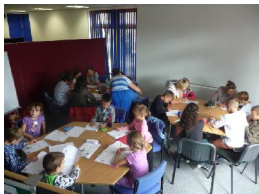
Učenci dopunske nastave